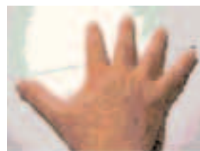
Mesurar un pam amb la mà

Després cadascun es mesura el seu propi braç des del dit del mig fins a l'espatlla. Quants pams fa?